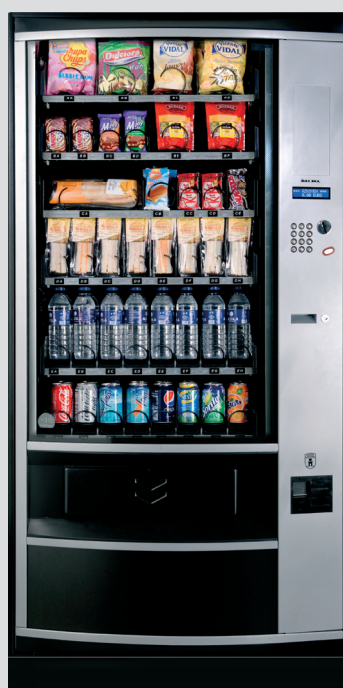
Palma + H87