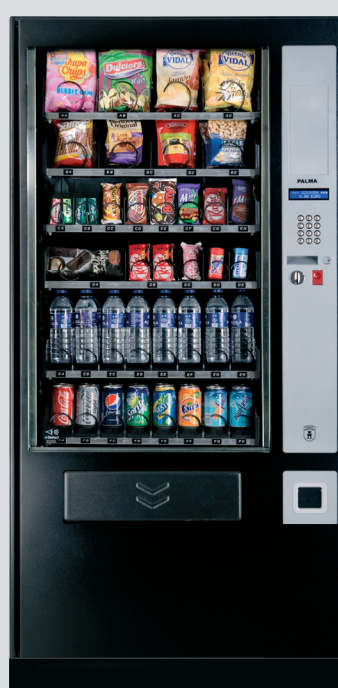
Palma + Hz87